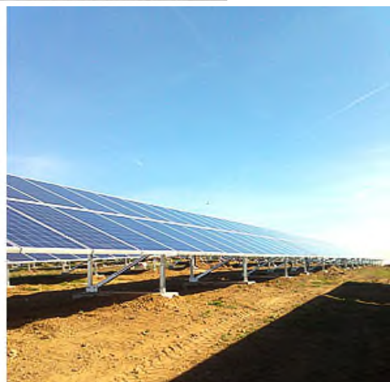
Viele Fundamente, keine Schalung notwendig

Verwaltung | Kilian Willibald GmbH Schlegldorf 75 · 83661 Lengries Tel. 08042/50 55 - 0 Telefax 08042/44 66 E-Mail info@kilian-willibald.de